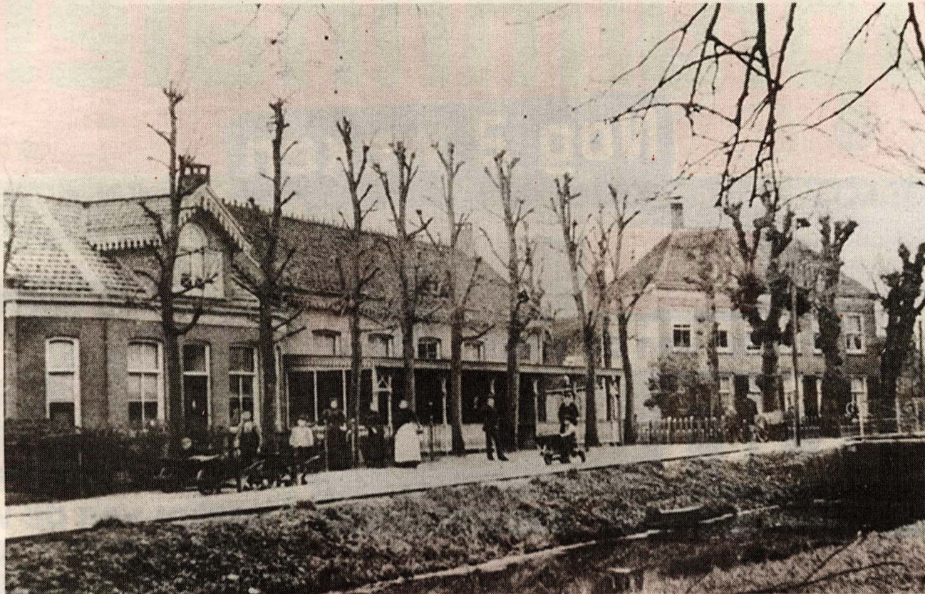
Een foto van omstreeks 1900 van de Geversstraat, Links is voormalig café Het Wapen van Oegstgeest te zien.

In de loop van de twintigste eeuw ging de horecafunctie verloren en kwamen er andere panden te staan: City-