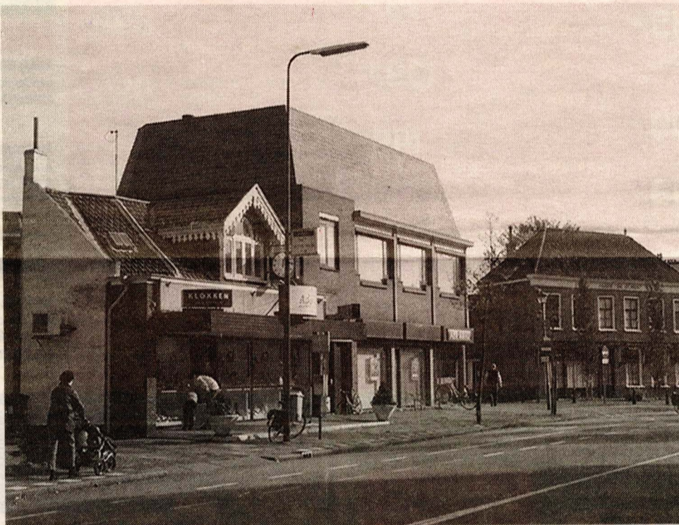
Dezelfde plaats in 2002. Na alle veranderingen zijn de bouwkundige verhoudingen niet meer met elkaar in harmonie.

Bazar en nadien DUTIM een medicijnenatelier (waarover in een latere uitgave meer). De jongste foto is van november 2002 en laat de huidige situatie zien met de ABN/Amro-bank. Links hiervan de juwelierszaak van Adorae (voorheen Plessen). De bouwkundige verhoudingen zijn niet meer met elkaar in harmonie. Wat ons mag verbazen is dat ondanks alle veranderingen de markante erker bewaard gebleven is!